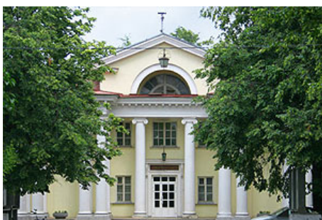
Научно-технический информационный центр (Дом учёных ЦАГИ)