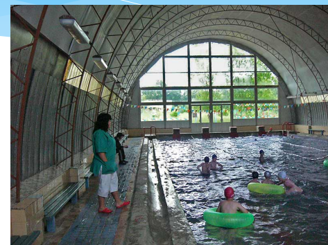
Оздоровительный комплекс «Салют»